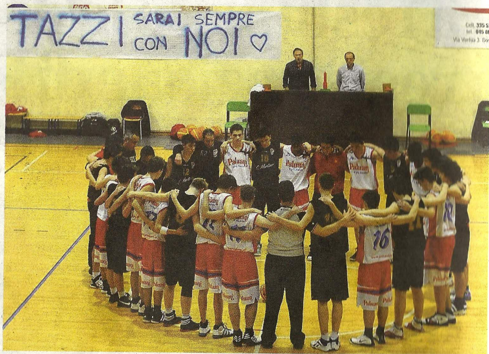
I compagni di squadra si raccolgono prima dell'inizio partita in ricordo di Massimo

dirigenti anche delle società vicine, seduti sugli spalti, presenti per assicurare agli under 17 supporto e calore. Ne avevano bisogno, anche se i ragazzi in campo si sono chiusi a cerchio, formando un'unica squadra per cercare di contenere i tumulti del cuore. Ed insieme all'arbitro Lanzarotto sono rimasti a lungo stretti l'un l'altro, alternati, attorno al cerchio della palla a due, in un minuto di raccoglimento, lungo ed commovente.