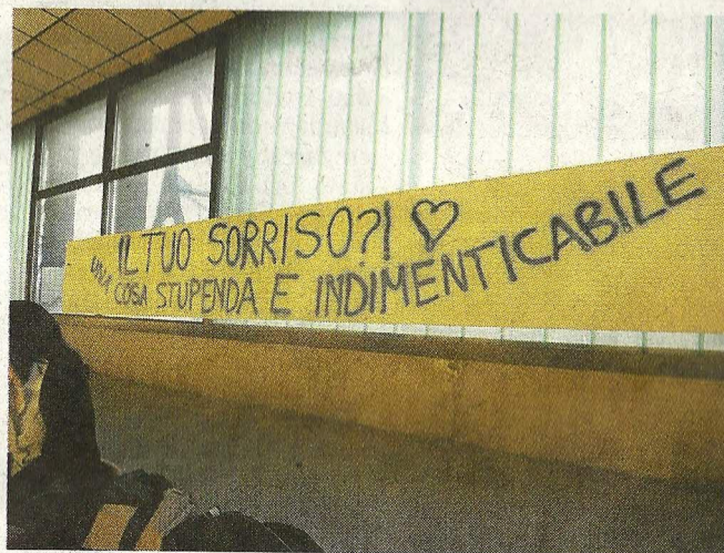
Uno degli striscioni dedicato all'amico scomparso